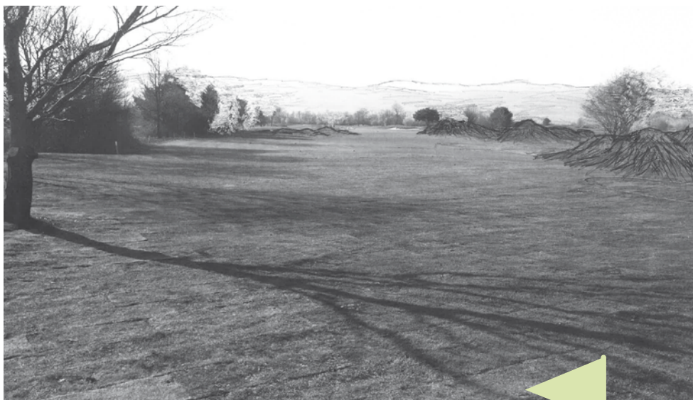
Perspective du Tee 1 avec les modulations à venir...